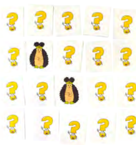
Мнемогра «Знайди пару» (20 карток 5×6 см)