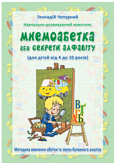
Методика вивчення мнемоабетки, формат А5, 32 с.

Навчально-розвиваючий комплекс "МНЕМОАБЕТКА або секрети алфавіту". Схвалено МОН України для використання у загальноосвітніх навчальних закладах ( лист II від 08.07.2020 р. №22.1/12-Г-522).