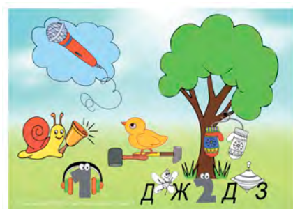
Мнемотренажер «Аналогії-підказки» формат А4