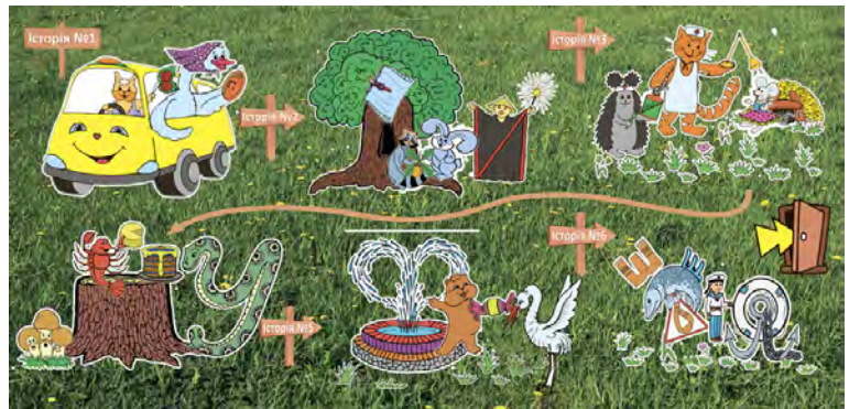
Мнемотренажер «Цікава екскурсія» (розмір 60×30 см)