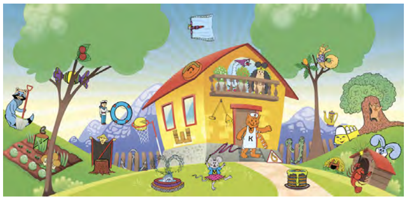
Мнемотренажер «Знайди букву» (розмір 60×30 см)