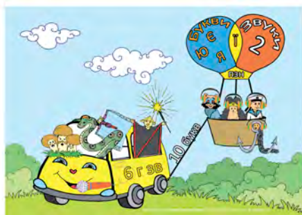
Мнемотренажер «Секрети голосних звуків», формат А4