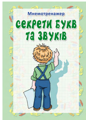
Мнемотренажер «Секрети букв та звуків», формат А6, 68 с.