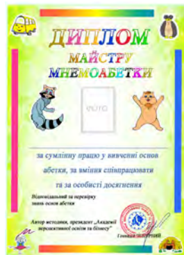
Диплом «Майстру мнемоабетки», формат А5